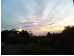
四季遊山からの夕焼け