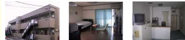
写真は一例です。また料金はタイプにより異なります。